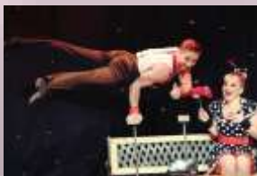
Duo Mechanic' Circus